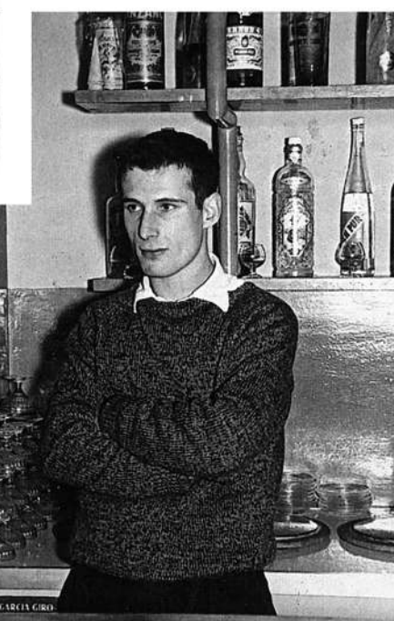
El Hotel Aran la Abuela, se inauguró como hotel en el 1955.